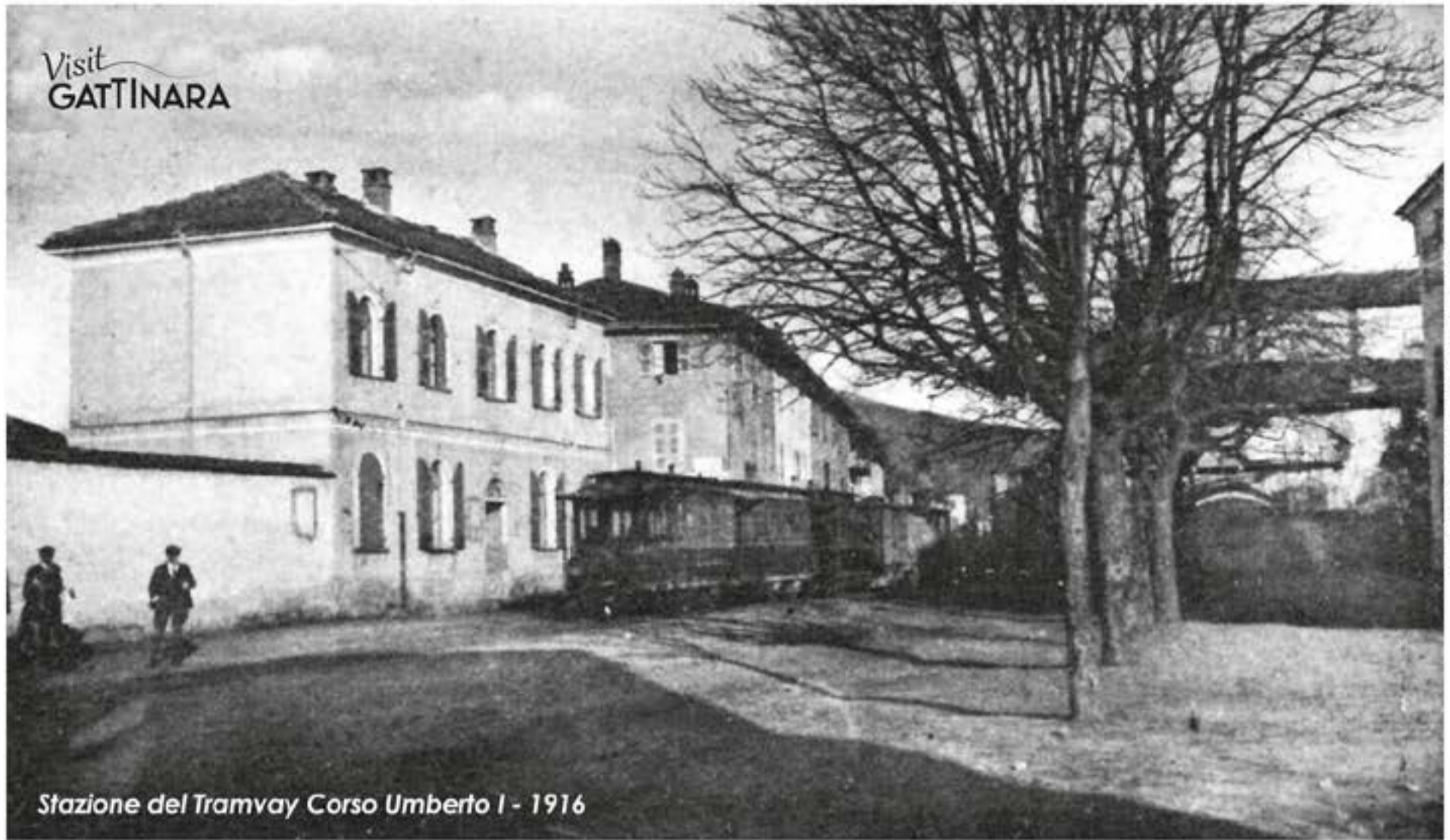
Stazione del Tramway Corso Umberto I - 1916