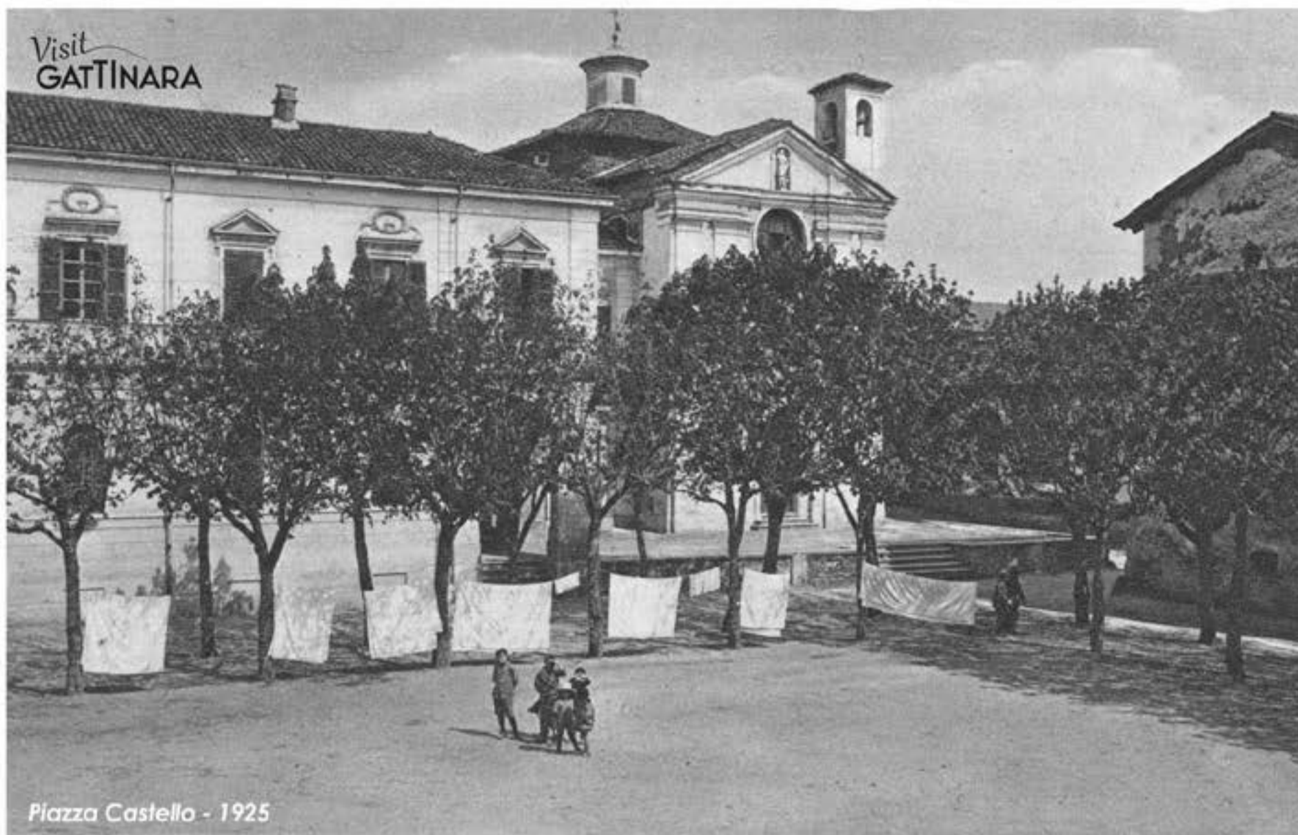
Immagine - Collezione privata Fabrizio e Valter Rusolino