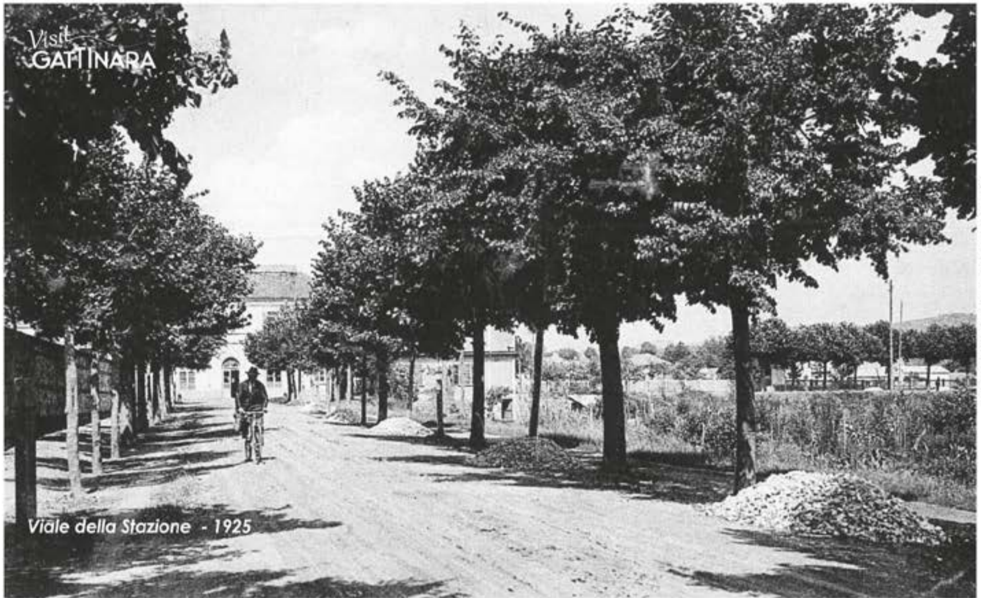
Immagine - Collezione privata Fabrizio e Wilter Buscolino